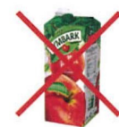
KARTONY PO NAPOJACH, MLEKU