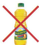
OPAKOWANIA PO OLEJACH