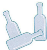
BUTELKI PO NAPOJACH